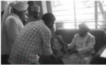
આણંદ મુકામે નિતિશાભાઈ ૬૬૨ (સ્પેસ ઈન્ટરનેટ સર્વિસ) ઓફિસે પધરામણીનો લાભ આપતાં પ.પૂ.આચાર્ય મહારાજશ્રી તા. 3/5/2019