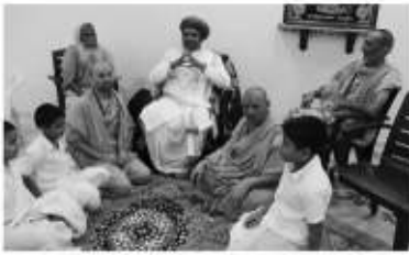
વડતાલધામ મુકામે પૂ.અથાણાવાળા સ્વામીના આસને પધરામણી કરતાં પ.પૂ.આચાર્ય મહારાજશ્રી એવં પૂ.સંતો.