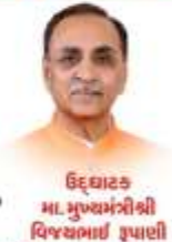
ઉદ્ઘાટક મા.મુખ્યમંત્રીશ્રી વિજયભાઈ રૂપાણી