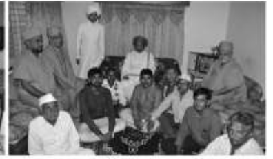
ભાચાવદર (અમરેલી) મુકામે હરિભક્તોના ઘરે પધરામણીનો લાભ આપતા પ.પૂ.આચાર્ય મહારાજશ્રી. તા.૭/૫/૨૦૧૭