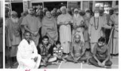
હરિદ્વાર ઉત્તરાખંડ મુકામે પૂ.હરિવલ્લભ સ્વામીની પ્રેરણાથી આયોજીત ૧૫ મા વાર્ષિક પાટોત્સવ પ્રસંગે ઉપસ્થિત પૂ.સંતો-ભક્તો. તા.૨/૫/૨૦૧૭