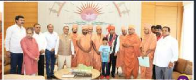
गांधीनगर मुकामे मान.मुष्यभंत्रीश्री विजयभाई इपाणीनी शुभेच्छा मुलाकाले पधारला वडताल मंदिरनां पू.संतो ऐवं ट्रेस्टीगण. ता.७/५/२०१७