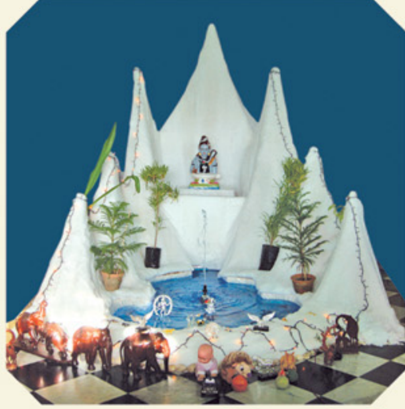
અક્ષરભુવન ઉપરના માળે હિમાલયની છબી