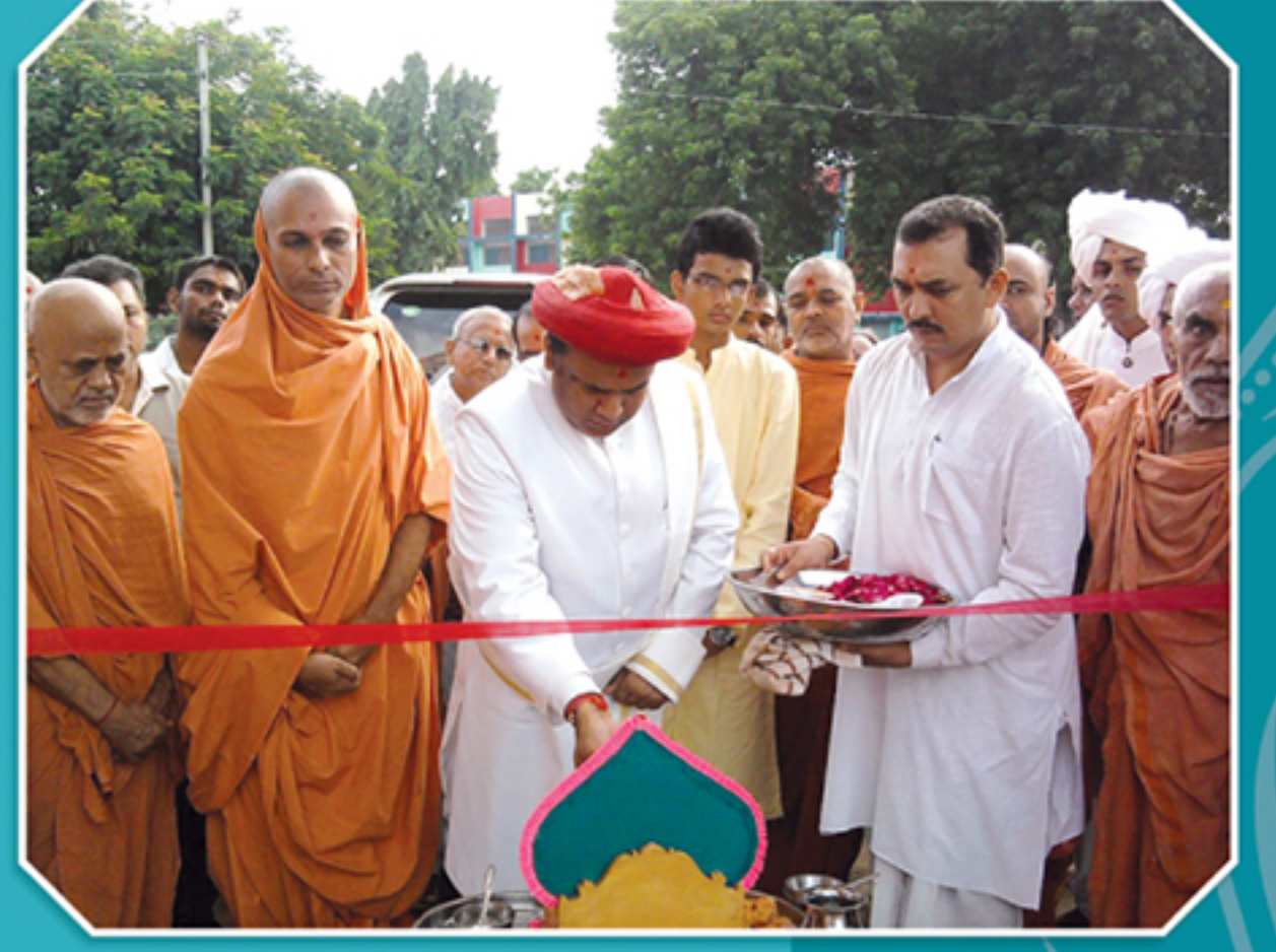
વડતાલમાં સંતોના વરંડામાં નવા બનાવેલ આર.સી.સી. રોડનું ઉદ્ઘાટન કરતા પ. પૂ. મહારાજશ્રી તથા મુખ્ય કોઠારીશ્રી અને સંતો