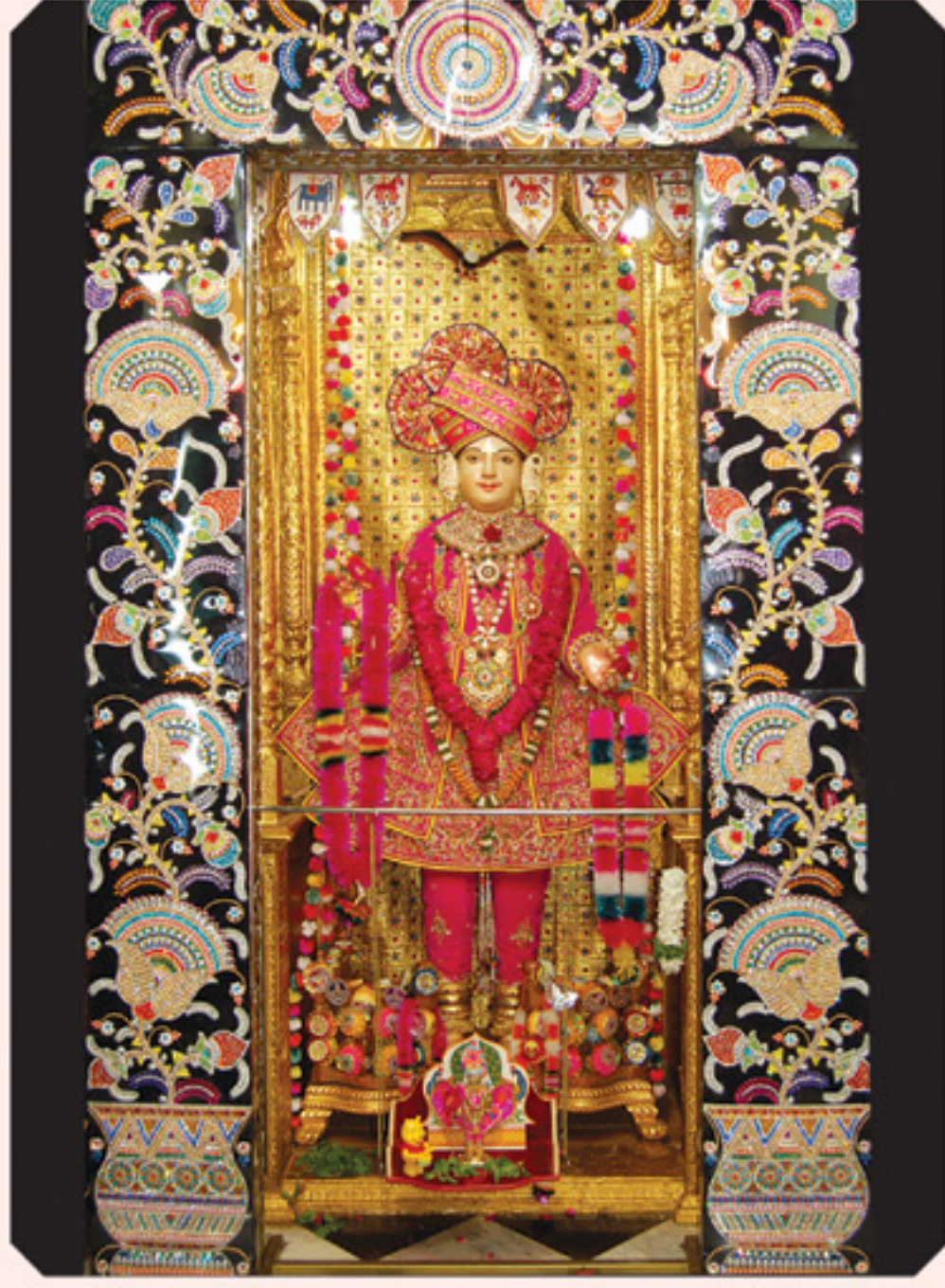
હીરા-નંગ જડિત હિંડોળામાં શોભતા શ્રી ઘનશ્યામ મહારાજ - અક્ષરભુવન-વડતાલ