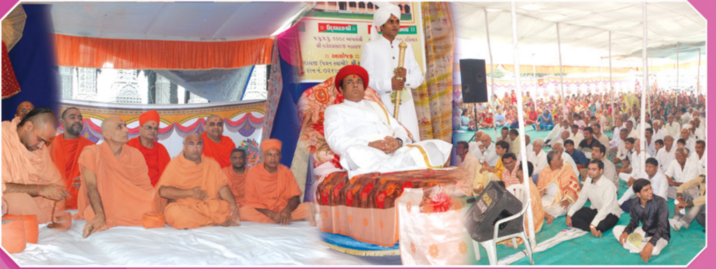
શ્રી સ્વા. ના. મંદિર-ડાકોર, નૂતન શ્રી નિત્યાનંદ અતિથિ ભુવન પ્રસંગે યોજાયેલ સભામાં પ. પૂ. મહારાજશ્રી તથા પૂ. સંતો - ભક્તો