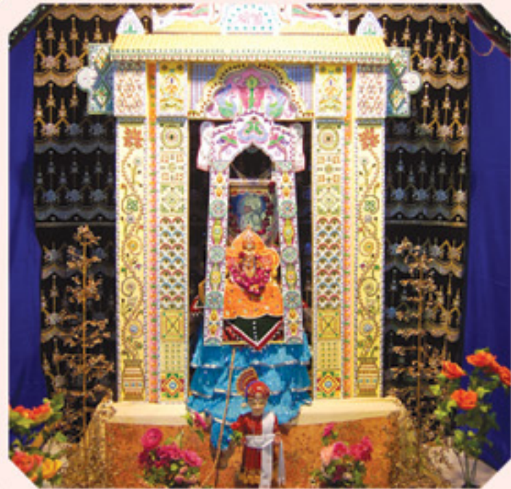
થરમોકલ તથા ઝરી, મોતીના હિંડોળામાં સુલતા શ્રીહરિ શ્રી સ્વા. મંદિર-મેતપુર