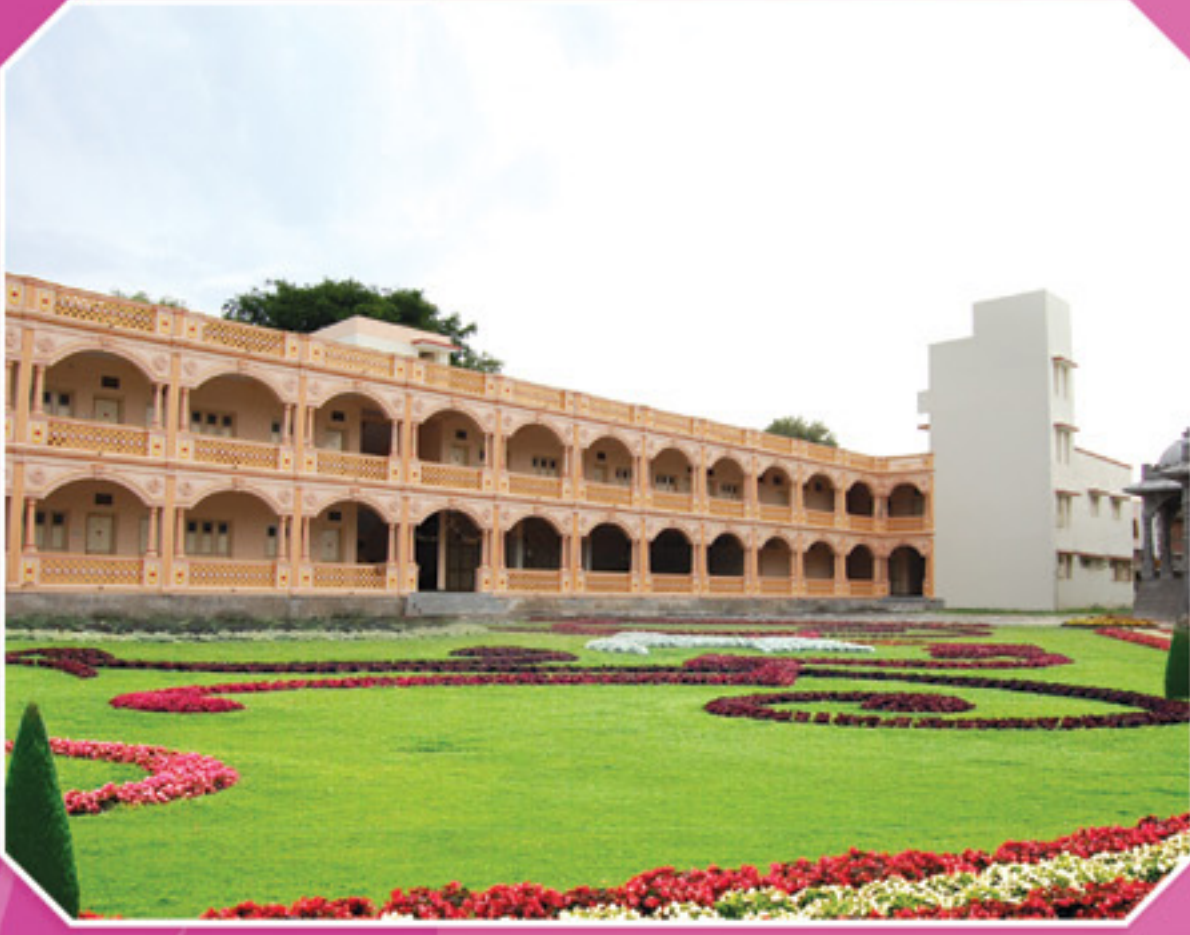
શ્રી સ્વા. મંદિર - ડાકોર દ્વારા તૈયાર થયેલ નૂતન શ્રી નિત્યાનંદ સ્વામી અતિથિ ભુવન