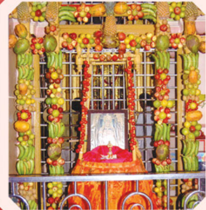
કુટના હિંડોળામાં સુલતા શ્રીહરિ - શ્રી સ્વા. મંદિર ખંભાત