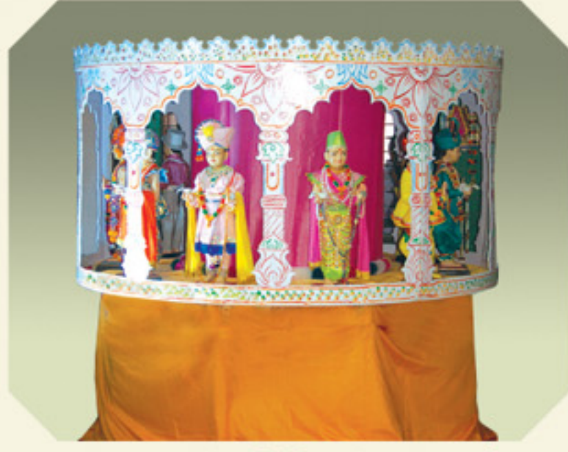
બારબારણાના હિંડોળામાં બાર સ્વરૂપે મુલતા બાલ ઘનશ્યામ - અક્ષરભુવન (નીચે)