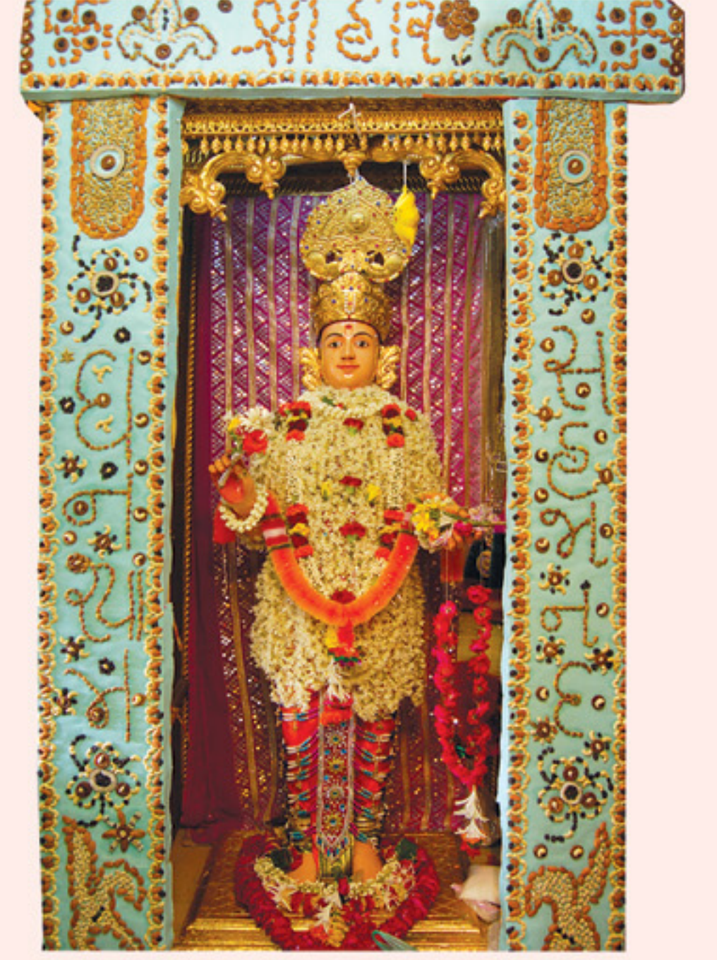
સુકા મેવાના હિંડોળામાં શોભતા શ્રી ઘનશ્યામ મહારાજ - શ્રીહરિમંડપ-વડતાલ