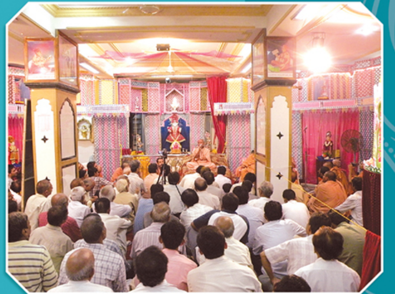
શ્રી સ્વામિનારાયણ મંદિર ભાયંદરમાં હિન્ડોળા મહોત્સવ પ્રસંગે આશીર્વાદ આપતા વડતાલ સંસ્થાનના ચેરમેન શ્રી તથા મુખ્ય કોઠારીશ્રીના આશીર્વાદનો લાભ લેતા ભાયંદરના હરીભક્તો