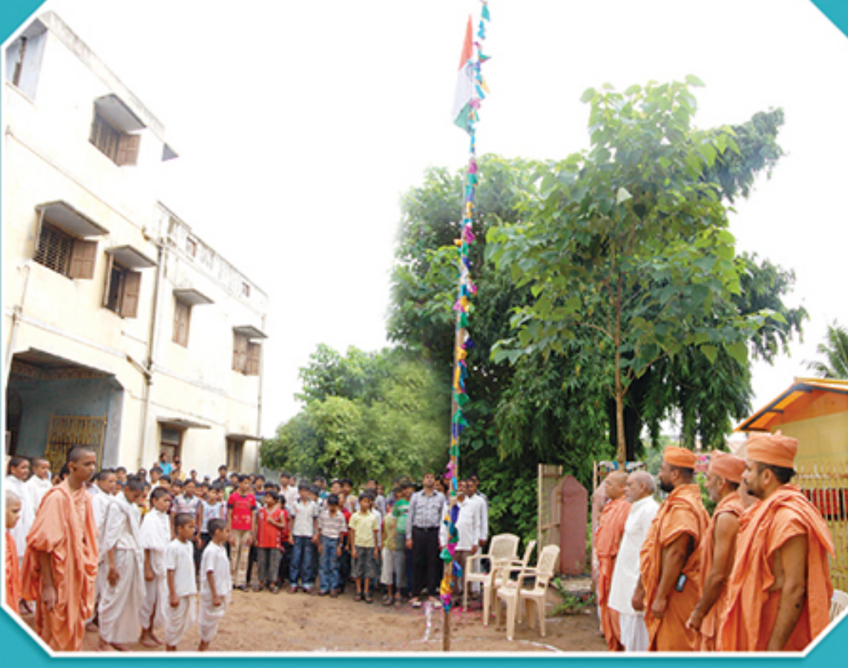
વડતાલમાં ૧૫મી ઓગ.-સ્વાતંત્ર્ય દિનની ઉજવણી કરતા સંતો તથા સંસ્કૃત પાઠશાળાના વિદ્યાર્થીઓ