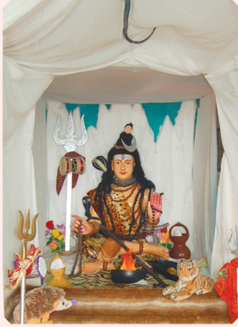
હિમાલયની ગુફામાં શિવ સ્વરૂપ ધારણ કરતા શ્રી ઘનશ્યામ મહારાજ - અક્ષરભુવન-વડતાલ