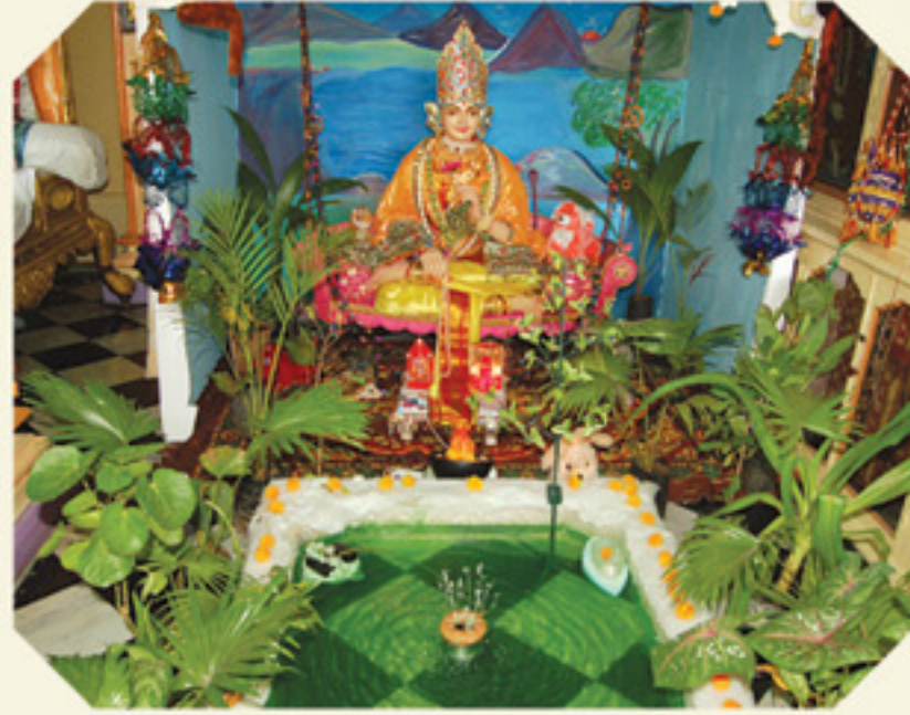
અક્ષરભુવન ઉપરના માળે પ્રાકૃતિક સૌંદર્ય નિહાળતા રાજધિરાજ શ્રીહરિ

વડતાલ શ્રી સ્વામિનારાયણ સંપ્રદાયની શ્રી લક્ષ્મીનારાયણ દેવની સંસ્થાનું સમસ્ત સત્સંગ સમાજનું માસિક