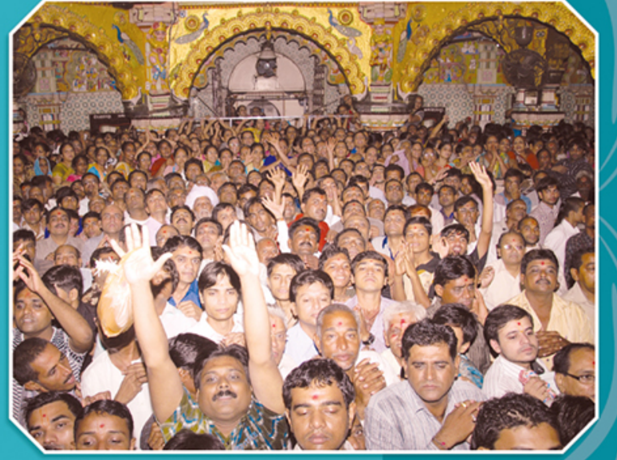
શ્રી સ્વામિનારાયણ વડતાલ મંદિરમાં ઉત્સવનો લાભ લેતા હરીભક્તો