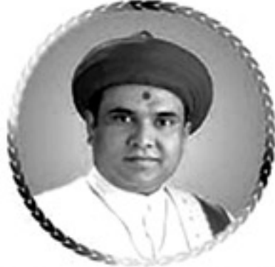
प.पू. आचार्य महाराजश्री