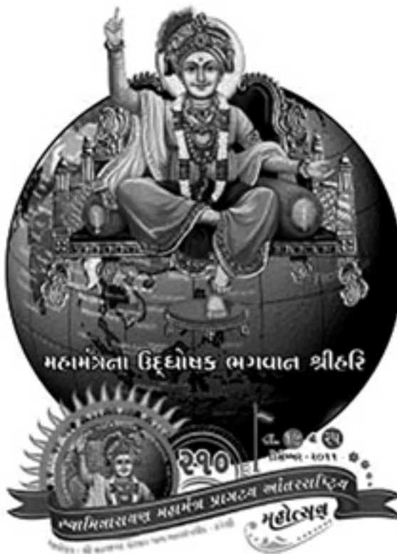
महामंत्रना उद्दिष्टोपड भगवान श्रीहरि