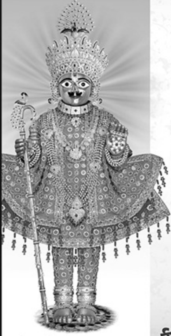
श्री हरिकृष्ण महाराज वडतालधाम