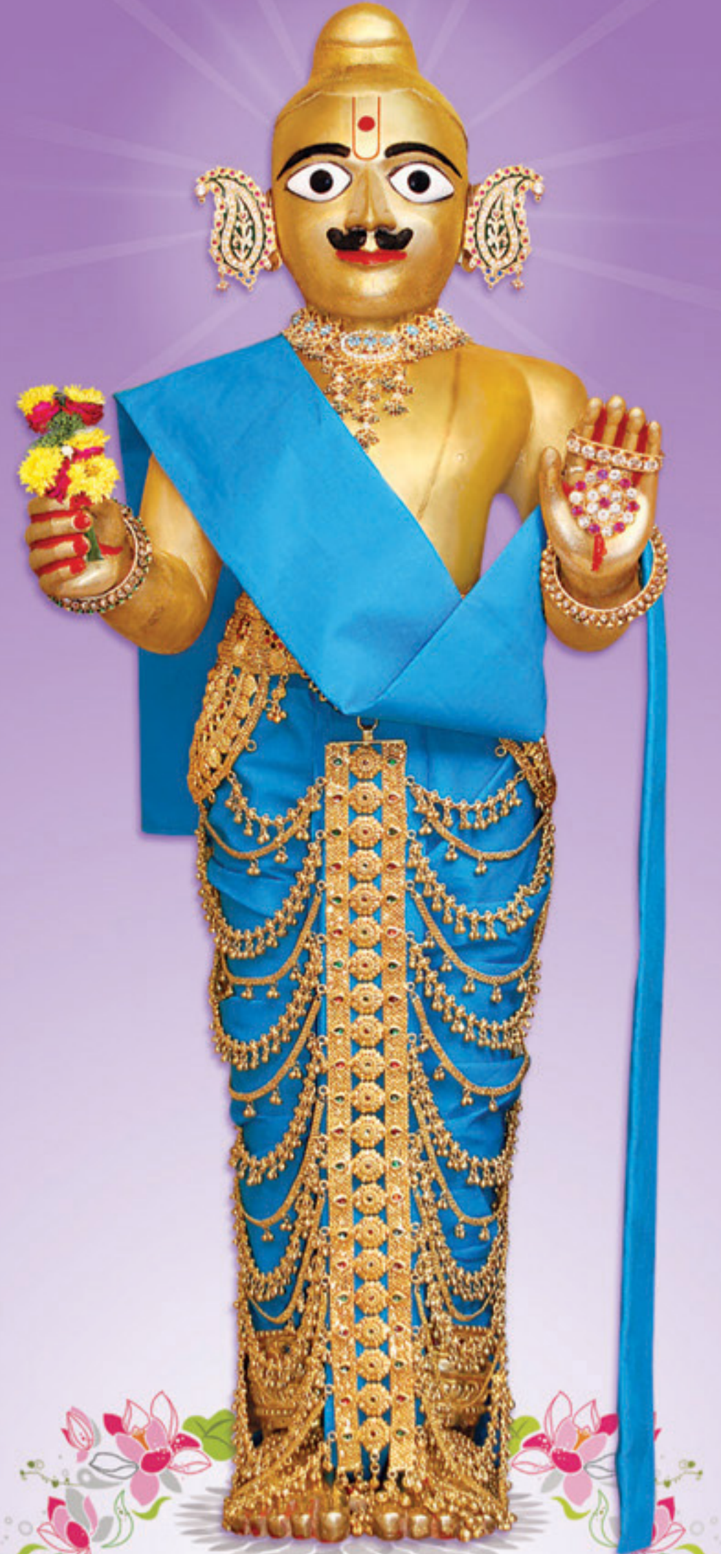
શ્રી હરિકૃષ્ણ મહારાજ - વડતાલધામ

વડતાલ શ્રી સ્વામિનારાયણ સંપ્રદાયની શ્રી લક્ષ્મીનારાયણ દેવની સંસ્થાનું સમસ્ત સત્સંગ સમાજનું માસિક