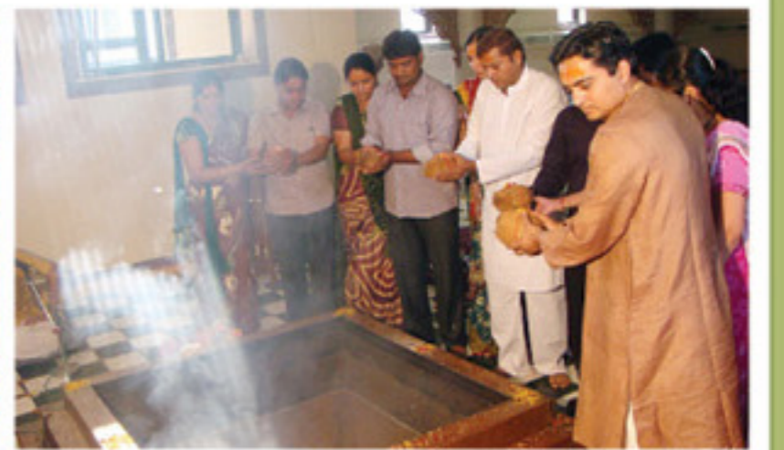
સારંગપુરમાં મારૂતિ યજ્ઞમાં પૂ.મહારાજશ્રીની પઘરામણી તથા યજ્ઞમાનોને આર્શીવાદ આપતા પૂ.મહારાજશ્રી