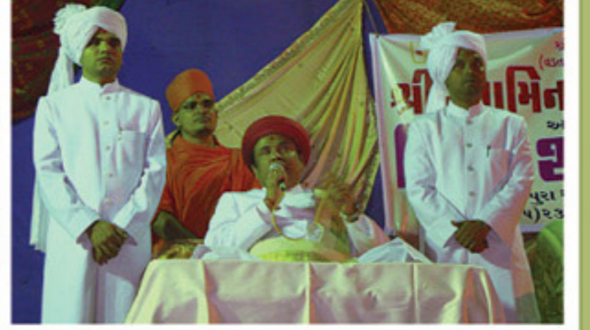
શ્રી સ્વા. મં.ગોત્રી વડોદરામાં હરિભક્તોના ઘેરઘેર મહારાજશ્રીની પઘરામણી - મહાપૂજન કરતા પૂ. મહારાજશ્રી શાકોત્સવ સભામાં દર્શન-આશીર્વાચનનો લાભ આપતા પૂ.મહારાજશ્રી તથા સંતો