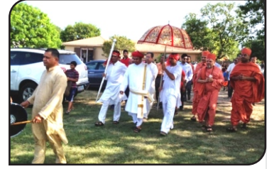
શિક્ષાપત્રી... (પાન ૧૭ નું ચાલુ)