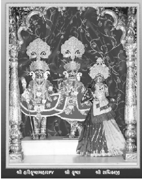
શ્રી હરિવૃંદાવલોક શ્રી વૃંદા શ્રી શરિષ્ઠરાજ