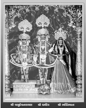
શ્રી વાસુદેવનારાયણ શ્રી ધર્મદેવ શ્રી ભદ્રિનિભાલા