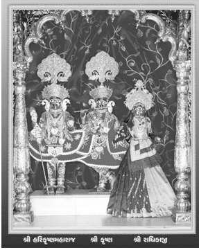
શ્રી હરિવલ્લભદાસજી શ્રી કૃષ્ણ શ્રી સચ્ચિદાનંદ